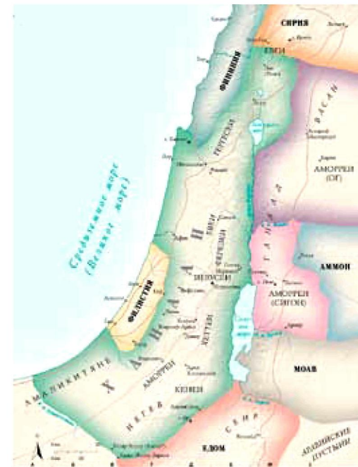
Ханаан в древности и прилегающие территории. https://spravochnick.ru

Вторым Израильским царем стал Давид, который вскоре после того, как был помазан на царство (это произошло около