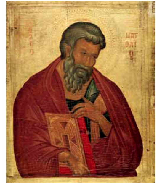
Святой апостол и евангелист Матфей. Икона. Византия. XIV в.

Ни об одном человеке не было столько сказано устно, сколько сказано и говорится об Иисусе Христе. В течение нескольких десятилетий после смерти и воскресения Иисуса информация о Нем распространялась преимущественно устным путем, и лишь на каком-то этапе своего развития Церковь начала письменно фиксировать устные предания. Евангелия не представляют собой исторический нарратив (повествование) в чистом виде. В Евангелиях нарратив соседствует с интерпретацией. Так, например, рассказ Евангелиста Матфея о рождении Иисуса от Девы Марии в Вифлееме представляет собой нарратив, тогда как цитаты из Ветхого Завета, при-